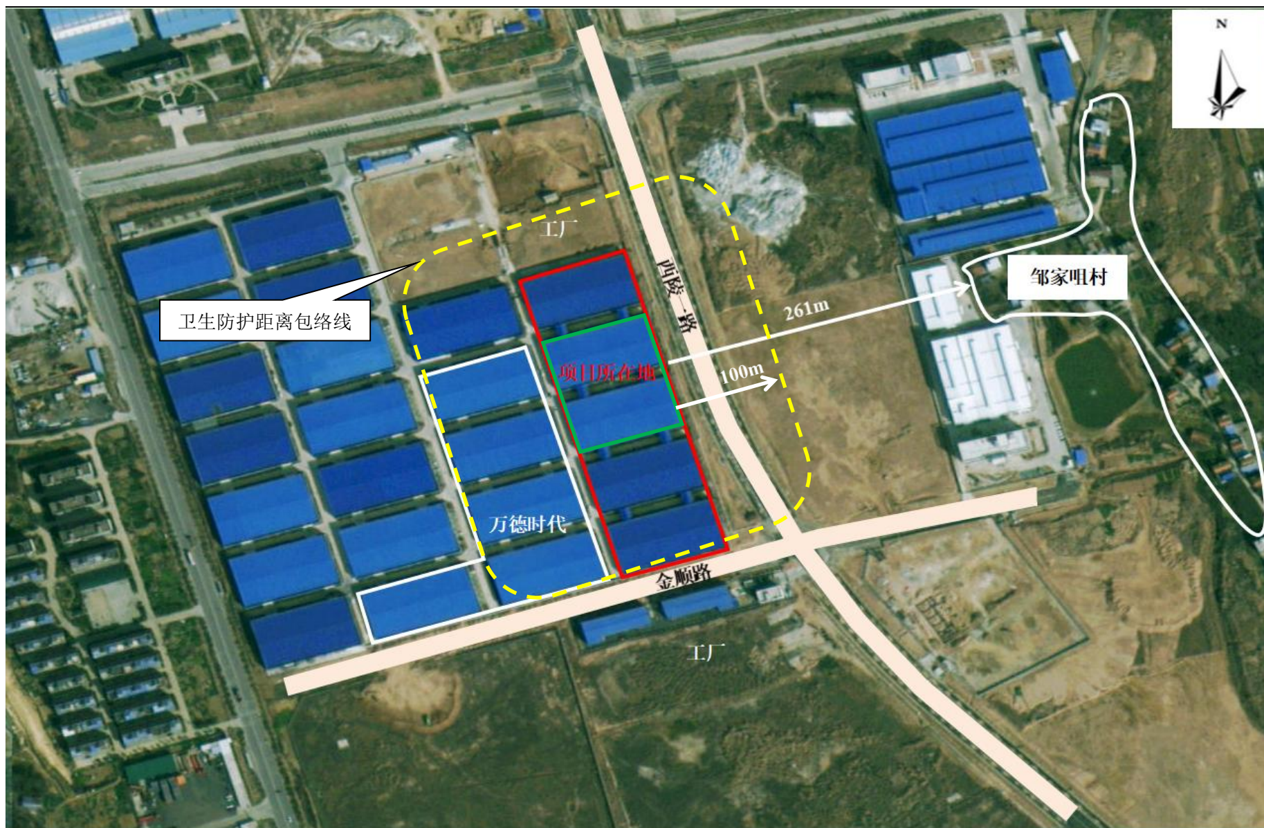
附图 5 项目卫生防护距离包络线图