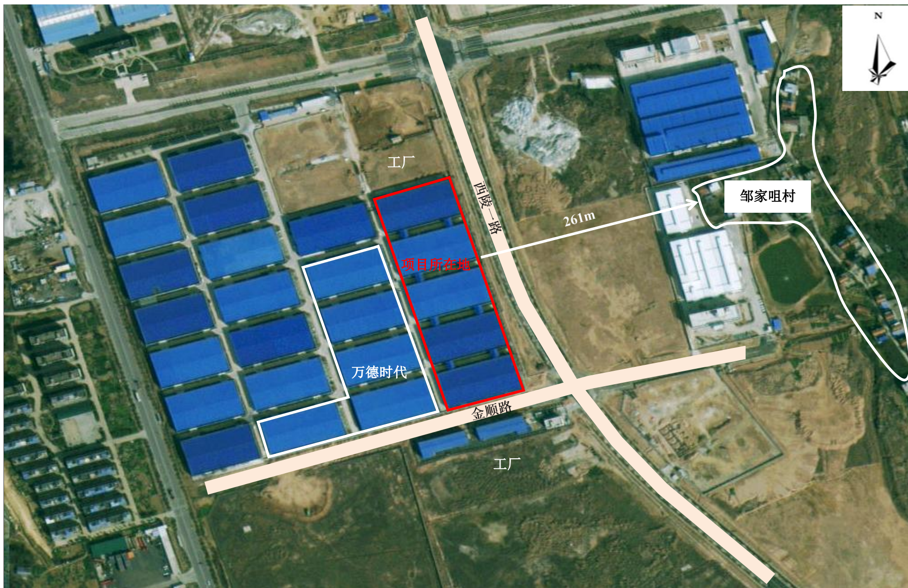
附图2 项目周边关系示意图